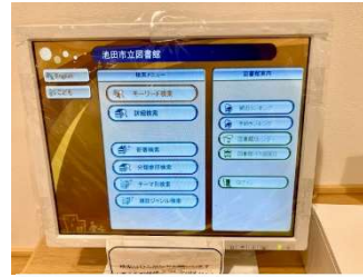
おぼく OPAC(けんさく機)