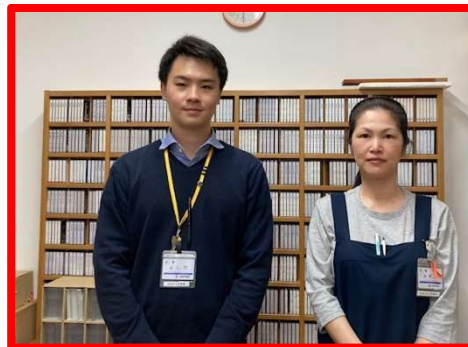
わたしたちに きいてください