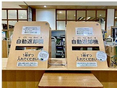
じどうへんきやくき 自動返却機