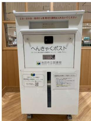
へんきやくほすと 返却ポスト