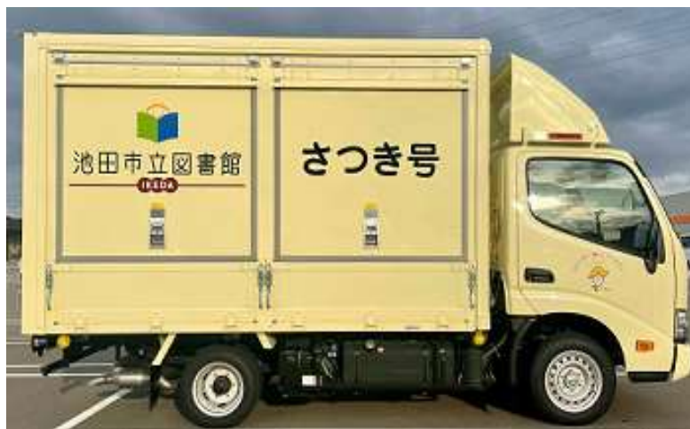
いとうとしょかん ごう 移動図書館さつき号